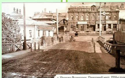
г. Иваново-Вознесенск, Приглашенный мост. 1910-е годы

В первой трети XIX века за Ивановом и окружающими его селами и деревнями, за уездными городами Шуей и Кинешмой прочно закрепляется репутация текстильного края. Его сравнивали с Англией, в то время славившейся своим текстилем (Иваново с легкой руки почетного гражданина Вознесенского Посада, известного ученого-экономиста, академика Владимира Безобразова стали называть «Русским Манчестером», Шую сравнивали с Ливерпулем). Дополнительным стимулом к складыванию этого промышленного района стало преобразование 2 августа (21 июля по ст. стилю) 1871 г. села Иванова и Вознесенского посада в город Иваново-Вознесенск.