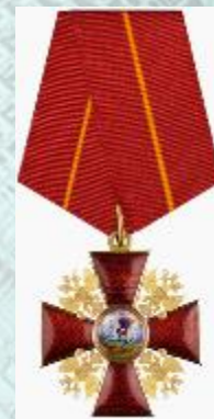
Орден Александра Невского