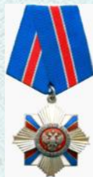
Орден «За военные заслуги»