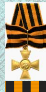
Знак отличия ордена Святого Георгия — Георгиевский крест