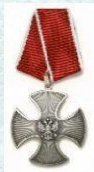
Орден «За мужество»