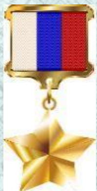
Медаль «Золотая звезда» Героя России