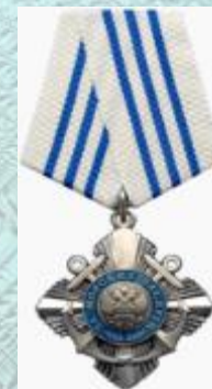
Орден «За морские заслуги»